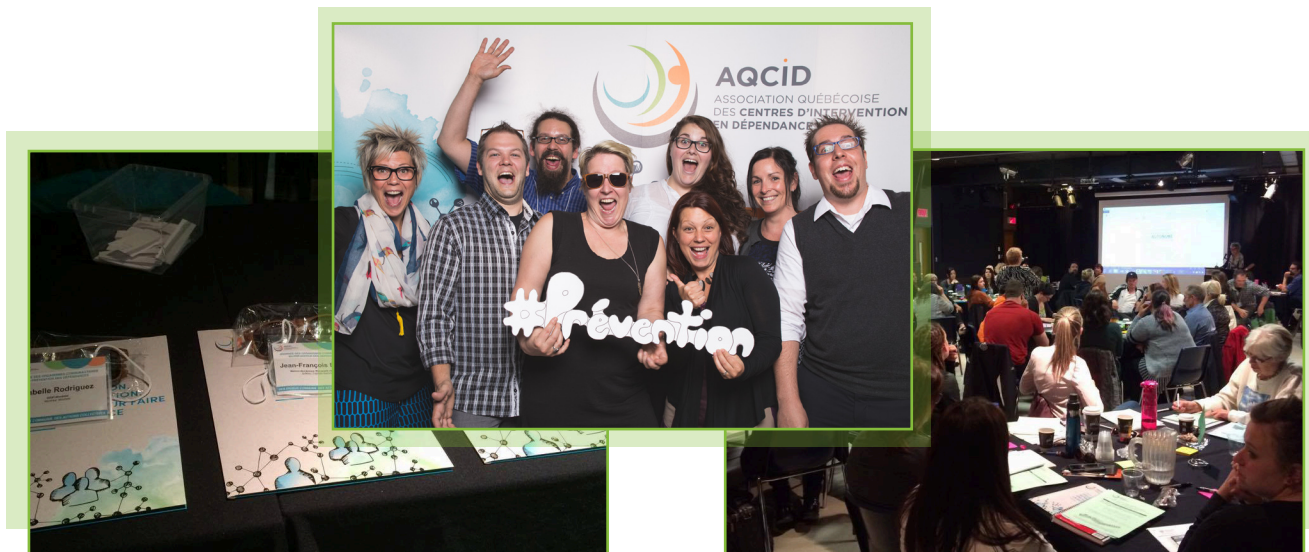
Photos : Prises lors de la journée des organismes communautaires en prévention des dépendances