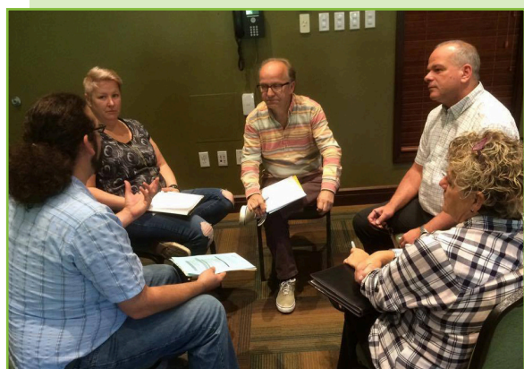
Photos : Prises lors du lac à l'épaule